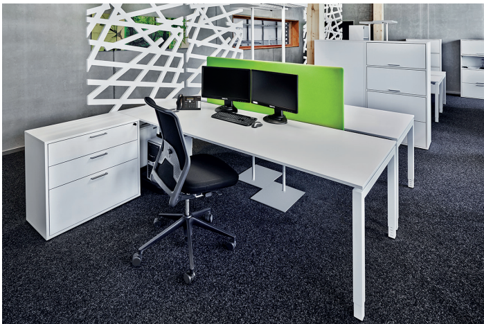
Die Einrichtung der Arbeitsplätze ist auf die jeweilige Arbeitssituation abgestimmt

«Für die Möblierung der neuen Büroräume wurde Witzig The Office Company hinzugezogen und beauftragt eine moderne, flexible Arbeitsumgebung mit prozessorientierten Teamarbeitsplätzen zu schaffen. Die Ansprüche an Kommunikation, Konzentration und Zusammenarbeit wurden berücksichtigt und in einer ansprechenden Art umgesetzt. Das Resultat kann sich sehen lassen.»