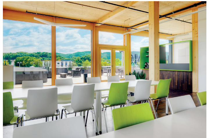
Cafeteria: Kommunikation pur: hier trifft man Mitarbeiter und Besucher.