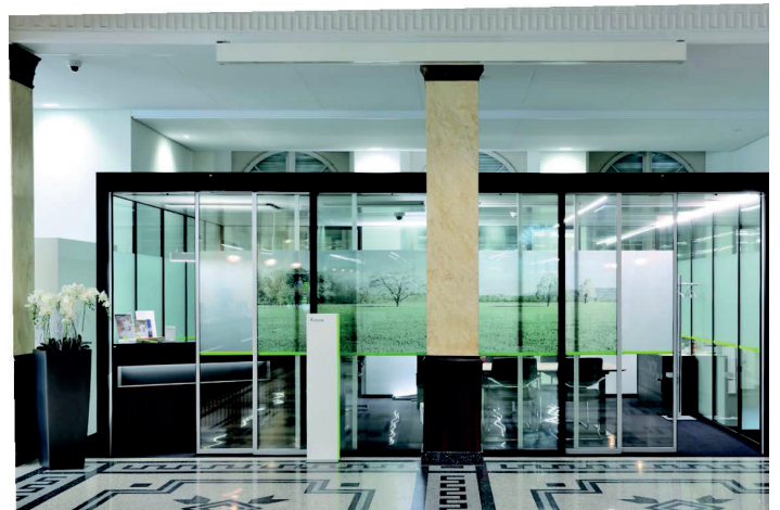
square´box mit elektrischen Schiebetüren: auf Knopfdruck Ruhe und Diskretion