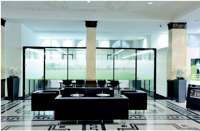
square´box, der Raum im Raum: auch ein dekorativer Blickfang

Der grosse Vorteil der neuen Räume mit Sichtschutzfolien ist ihre optische und akustische Diskretion. Kundengespräche können hinter verschlossenen Glastüren durchgeführt werden. Die multifunktionalen Beratungsräume sind zudem praktisch, da man am Arbeitsplatz jederzeit alle nötigen Unterlagen und Hilfsmittel griffbereit hat».