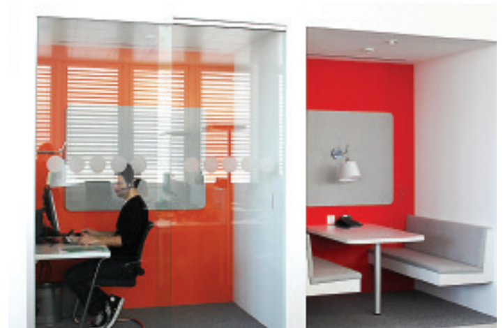
Konzentriertes Arbeiten und vertrauliche Besprechung: Fokusraum Rot/Orange