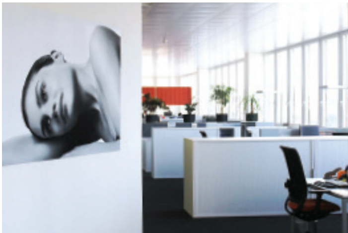
Kommunikation und Teamarbeit in einer angenehmen Umgebung: Open Space

«Die Qualität der ausgesuchten Büromöbel, der Swissness-Aspekt in der Herstellung und der Gesamteindruck von Design und Dienstleistung hat uns überzeugt. Die Zusammenarbeit mit Witzig The Office Company AG hat von A-Z geklappt.»