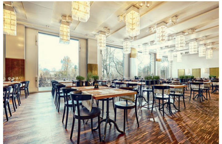
Im internen Restaurant wird die Theorie in die Praxis umgesetzt.