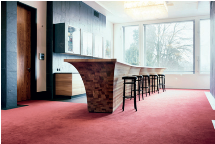
An einer Übungsbar werden Fähigkeiten und Kenntnisse vertieft.

«Mit dem neuen Gebäude verfügt Zürich über die modernste Hotelfachschule der Schweiz. Zudem steht das Gebäude am richtigen Ort – in Fussdistanz zum von uns geführten Restaurant Belvoirpark. Die Studierenden haben dadurch die einmalige Möglichkeit, Theorie, Anwendung und Praxis auf engstem Raum hautnah zu erfahren und ihre Kompetenzen dadurch laufend zu verstärken.»